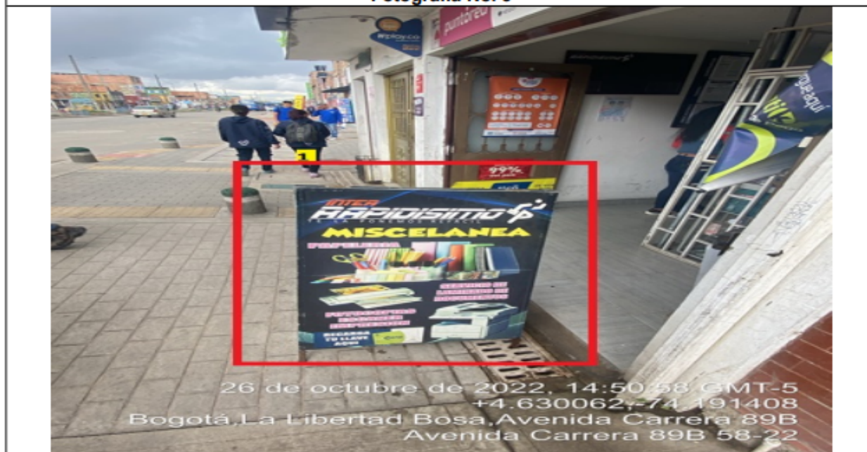
Fotografía No. 3

En la cual se evidencia un (1) elemento PEV perteneciente al establecimiento comercial denominado INTERRAPIDÍSIMO LIZCANO , el cual se encuentra ubicado en área de espacio público y es adicional al único elemento permitido por fachada de establecimiento comercial.